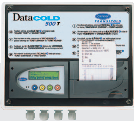
500 T til udendørs installation.

DataCOLD 500 registreringsapparater er testet og godkendt i henhold til den europæiske EN12830 norm, og lever op til kravene i 92/1/EU og 93/43/EU.