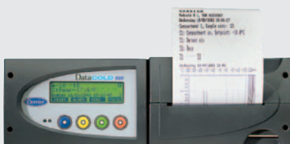
500 R til installation i førerhus.