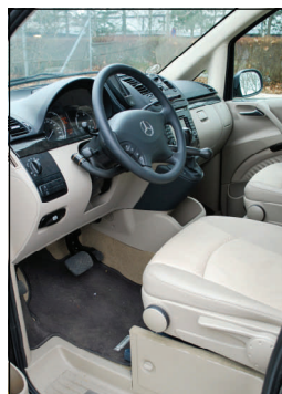
Bilens originale sædekonsol bevares så vidt muligt ved montering af 6-vejs konsol