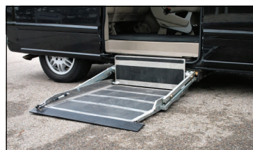
AMF underliggende lift

Det ekstra batteri er indbygget i passagerforstolens sokkel, og optager ikke plads i kabinen.