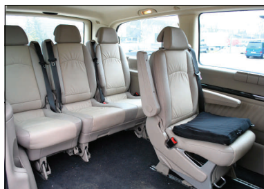
Bilens kabine er intakt med brug af sæder